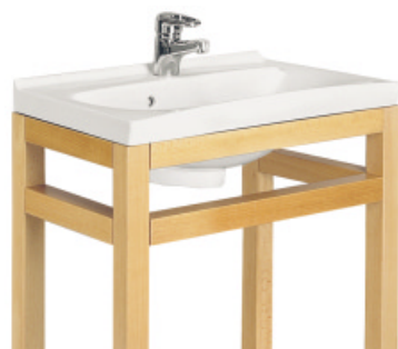
CERATOP COMPACT 60cm