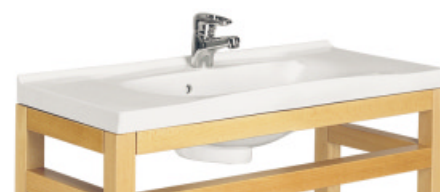
CERATOP COMPACT 90cm