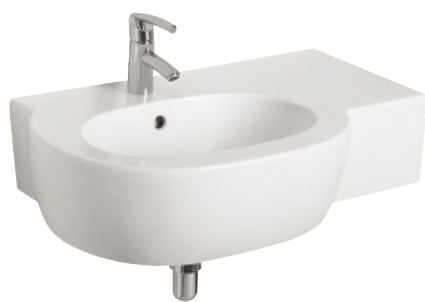
K11 180 - prawa